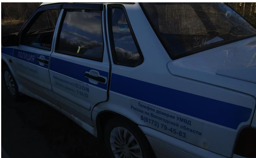
Два телефона доверия

Телефон доверия или отсутствует(Череповец), или нанесен наряду с телефоном доверия не соответствующего Приказу №808 (область)