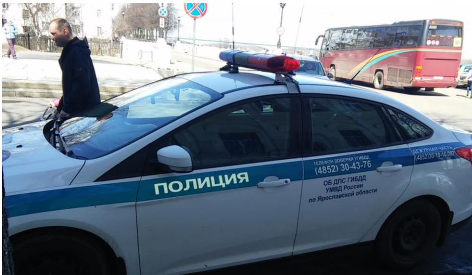
Два телефона доверия